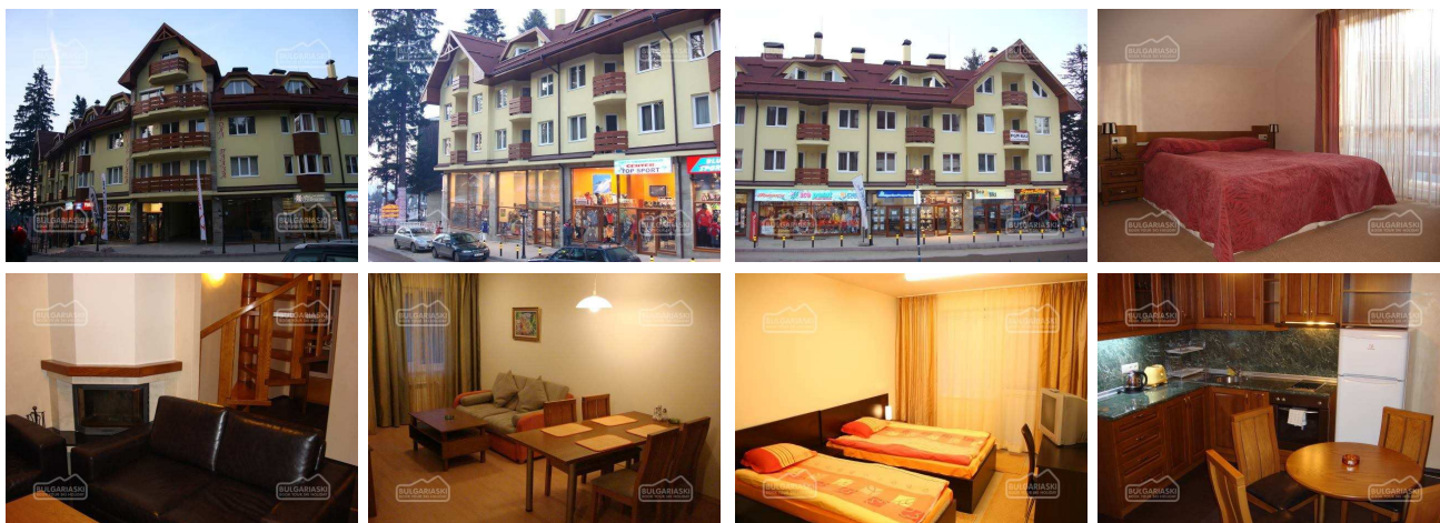
FOTO ALBUM - SKI RESORT BOROVETS